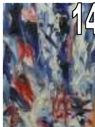
14 André Garant Huile Estimation 1000/1200 Offre minimale 300