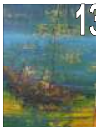
13 Nathalie St-Pierre Acrylique Estimation 600 Offre minimale 200