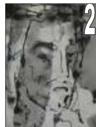
20 Basque Encre/Aquarelle Estimation 700/800 Offre minimale 200