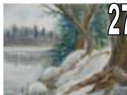
27 Annette Dion Aquarelle Estimation 350 Offre minimale 150