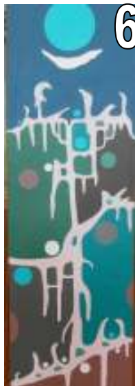
6 Jacques Lambert Acrylique Estimation 1 100 Offre minimale 500