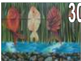
30 J. Jacques Hudon Acrylique Estimation 850/900 Offre minimale 400