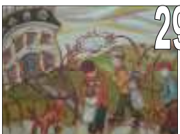
29 Lucie Richard Acrylique Estimation 600/700 Offre minimale 200