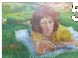
5 Marie Gravel Acrylique Estimation 650 Offre minimale 250